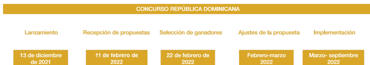
Figura 1. Cronograma del concurso de ideas para la República Dominicana.

El concurso de ideas iniciará en diciembre de 2021, en donde los postulantes tendrán dos meses para preparar y presentar su propuesta. En febrero de 2022 se seleccionarán y anunciarán las ideas beneficiadas junto a su paquete de apoyo respectivo. Los proyectos seleccionados, deberán realizar ajustes a su propuesta de ser necesario, y en marzo del 2022, se iniciará la implementación de estas ideas con el apoyo de la GIZ.